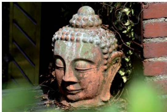
Die Tibetische Medizin beruht auf den Prinzipien des Buddhismus.

Die 46-Jährige ist hier, weil ihr die Ärzte versicherten, sie sei gesund. Ihre unregelmäßige Menstruation wurde als Symptom beginnender Wechseljahre