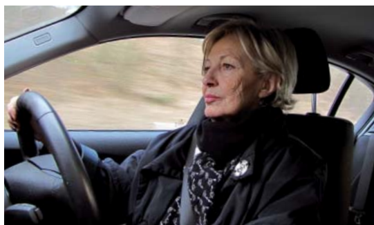
Langes Sitzen ohne Unterbrechung, ob bei Autofahrten oder im Theater, können ein Restless-Legs-Syndrom auslösen.

eine einmalige Gabe von L-Dopa die Symptome dramatisch bessert, ist dies der diagnostische Beweis, dass RLS vorliegt!“, so der Internist. Zusätzliche Untersuchungen sind dennoch wichtig, um andere Erkrankungen auszuschließen.