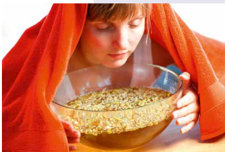
Ein Dampfbad mit Kräutern wie Kamille unterstützt die Hautpflege bei Akne.

Die chinesische Bezeichnung für Akne bedeutet übersetzt so viel wie „weiße Dornen“ – das typische Akne-Hautbild kommt hier bildhaft zum Ausdruck. Sie manifestiert sich mit tiefen, großen Pickeln oder Eiterpusteln, vor allem im Gesicht, am Hals, Dekolletée und Rücken. Oft bleiben unschöne Narben und verfärbte Hautstellen zurück.