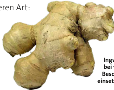
Ingwer ist bei vielerlei Beschwerden einsetzbar.

Ingwer ist ein Genuss der besonderen Art: Die aus Südostasien stammende Wurzel schmeckt herrlich scharf, erfrischend zitronig und dennoch leicht süß. Sie verleiht vielen Speisen eine einzigartig exotische Note. Die Inhaltsstoffe machen Ingwer zu einer wertvollen Heilpflanze, die in China, aber auch bei uns seit Jahrhunderten verwendet wird.