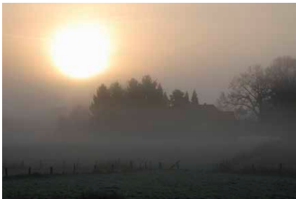
Wenn die Sonne im Winter an Kraft verliert, wirkt sich das häufig auf die Stimmung aus.

D unkelheit ab fünf Uhr Nachmittag – der Winter stellt unsere Stimmung manchmal auf den Prüfstand. Denn Lichtmangel schlägt aufs Gemüt, das ist wissenschaftlich belegt. Er kann zu Antriebslosigkeit, erhöhtem Schlafbedürfnis oder sogar zu einer Winterdepression führen. So schüttet die Zirbeldrüse im Gehirn, wegen des geringeren Lichteinfalls im Auge, größere Mengen des schlaffördernden Hormons Melatonin aus – auch tagsüber. Infolge der starken Melatonin-Einwirkung sind