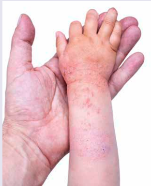
Bei kleinen Kindern beginnt Neurodermitis häufig an den Armen.

Die atopische Neurodermitis ist eine chronische, meist juckende, oberflächliche Entzündung der Haut. Der Juckreiz ist nachts oft besonders stark und führt zu schlechtem Schlaf und Übermüdung. Oft lässt das Jucken erst nach, wenn sich der Betroffene blutig gekratzt hat. Häufig liegen allergische Erkrankungen bereits in der Familie vor. 10 Prozent aller